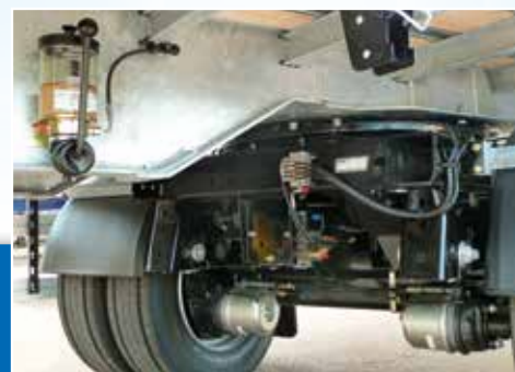
Graissage centralisé manuel ou automatique*