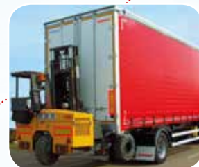
ÉQUIPEMENT CHARIOT EMBARQUÉ