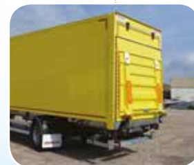
HAYON ÉLÉVATEUR RABATTABLE