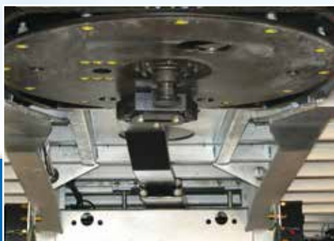
Plaque d'attelage pivotante avec bras de renvoi