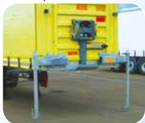
BÉQUILLES STABILISATRICES DE SÉCURITÉ