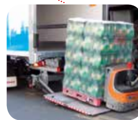
HAYON ÉLÉVATEUR RÉTRACTABLE