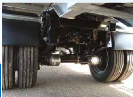
Essieu arrière sur bâti renforcé pivotant de 12 tonnes